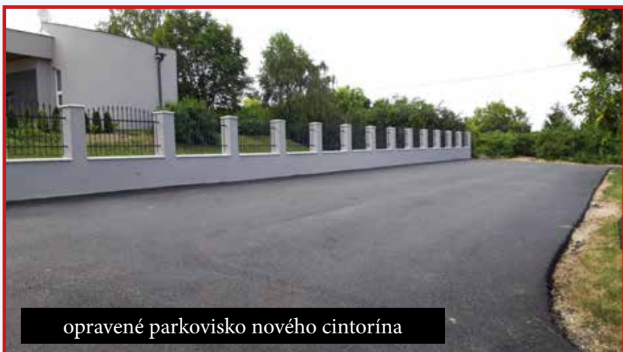
opravené parkovisko nového cintorína

Obmedzenia koronakrízy však do života našej obce pri-