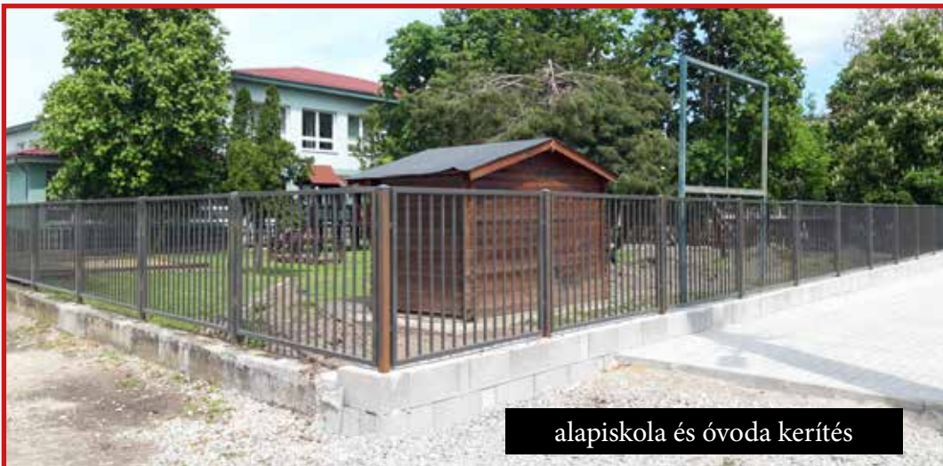
alapiskola és óvoda kerítés

Figyelembevéve a 2020-as év negatívumait, a község szemszögéből az előrejelzett pénzügyi korlátozások ellenére kijelenthetem, hogy talán elégedettek lehetünk, mivel a köztulajdon fejlesztésébe ebben a hektikus évben is 132.379 eurót investáltunk. Köszönöm mindenkinek, aki bármilyen módon segített elérni ezeket az eredményeket, illetve díjmentesen szponzorálta néhány aktivitásunkat.