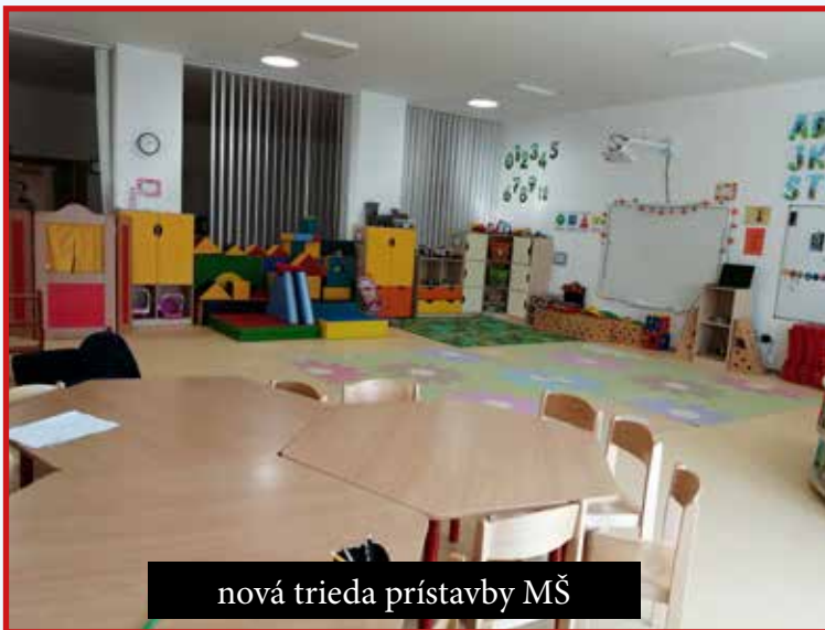
nová trieda prístavby MŠ

Aj počas roka sme stihli vykonať niekoľko drobnějších a menej nákladných investícií: do klubu dôchodcov veľkého kultúrneho domu sme zakúpili nové zariadenie; doplnili sme kuchyne kultúrnych domov novým inventárom; vymenili sa sietidlá v sálach oboch KD; opravila sa mozaika na priečelí malého kultúrneho domu; vybudovali sme chodník od lávky ku kostolu; zrekonštruovali plot nového cintorína; zhotovili sme nové oplatenie základnej a materskej školy. Za tieto menšie práce sme zaplatili vyše 12.000 eur. Pomocou miestnej stavebnej firmy Kôňastav sme začali budovať aj odjazdový chodník z nového cintorína a dúfam, že počasie nám dovoľí dokončiť túto stavbu do sviatku pamiatky našich zosnulých.