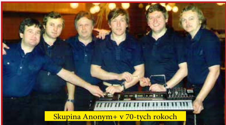
Skupina Anonym+ v 70-tych rokoch